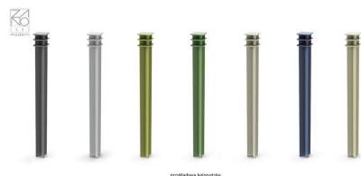
profilene i aluminium

01.083 er en pullert med et interessant design. Den er laget av stålelementer og fanger blikket med sin omhyggelige utførelse og uvanlige form. Det er absolutt et attraktivt alternativ til de vanlige pullertene som er tilgjengelige. Den presenterte modellen er produsert av svart stål eller rustfritt stål. Installasjonen skjer ved hjelp av et betongfundament. På spesiell forespørsel kan fargen på stolpestrukturen velges fra den tilgjengelige RAL-paletten.